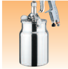
Artikelnr. für Saugbecher KR-566-1-B

Advance HD-Spritzpistolen werden in folgenden Varianten angeboten: Kesselpistole, Saugbecherpistole mit Becher (1 Liter) und Fließbecherpistole mit Standardfließbecher (568 ml).