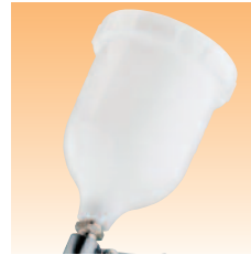
Artikelnr. für Fließbecher GFC-501