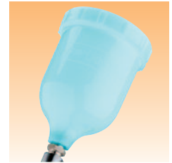
Fließbecher (blauer Polyester) Artikelnr. GFC-511 für schwierige Beschichtungsstoffe